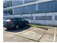
Buitenparkeerterrein COG Makelaars BV, nummers 34, 35 en 36

Buitenom via de hoofdingang aan de Maanweg 174 kunt u naar binnen. De liften bevinden zich aan de linkerkant. Wij zitten op de 13 e verdieping.